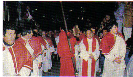
Procession du vendredi saint à Sartène: le Catenacciu portant sa croix.

Aujourd'hui les deux églises, grecque et latine, se font face. Dans la chapelle grecque, débute à minuit, le samedi de Pâques, la liturgie de l'Obscurité. Les fidèles viennent un à un allumer leur cierge au cierge pascale, "cette lumière qui ne s'éteint jamais", puis débute l'office de l'ouverture des portes. Le célébrant demande: "Qui est ce roi?". De l'extérieur, les fidèles lui répondent: "Celui qui a vaincu la mort".